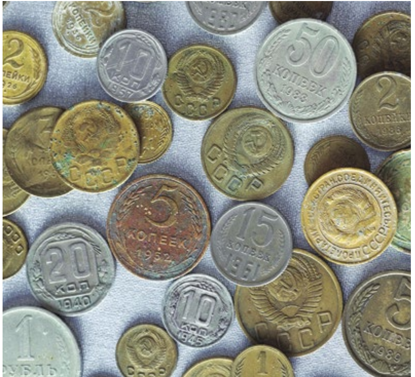
Монеты СССР разных лет

В Архиве президента Российской Федерации сохранился рукописный экземпляр постановления Президиума ЦК КПСС от 30 октября 1958 года по вопросу о деноминации рубля. Он рассматривался руководством СССР в лице Н.С. Хрущева, А.Г. Зверева, А.И. Микояна и А.Н. Косыгина. Было решено «принять предложение товарища Хрущева о проведении деноминации рубля», тогда же определили сокращение «его нарицательной стоимости примерно в 10 раз». Министр финансов СССР Зверев получил поручение «с соблюдением строгой