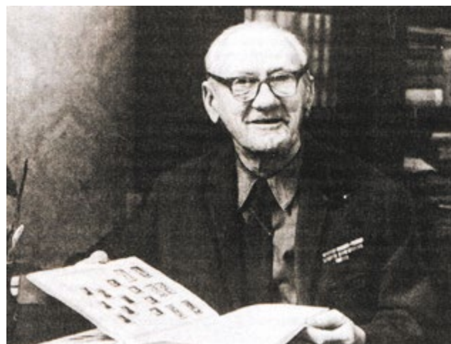
Иван Иванович Дубасов был главным художником Гознака на протяжении почти 40 лет

На обороте сторублевки печатался вид Московского Кремля, что стало традицией для советских денег начиная с 1947 года. Впрочем, на этот раз вид был не панорамный, с Большого Каменного моста, а с Водозводной башней на переднем плане.